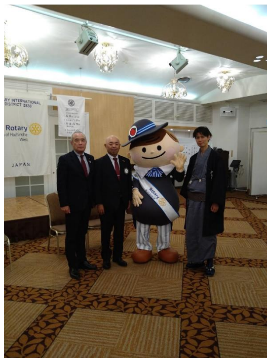
▲左から築館ガバナー、畠山会長、 ロータくん、村岡幹事