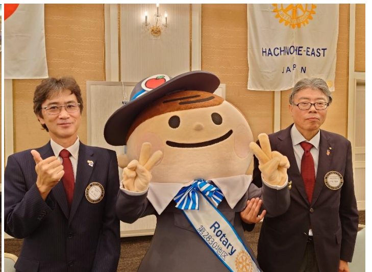
▲林会長（左）と赤坂幹事