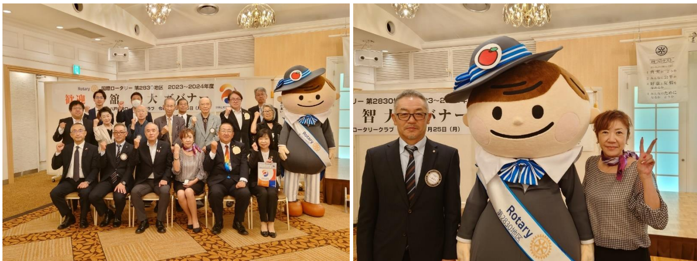
▲工藤会長（左）と築田幹事