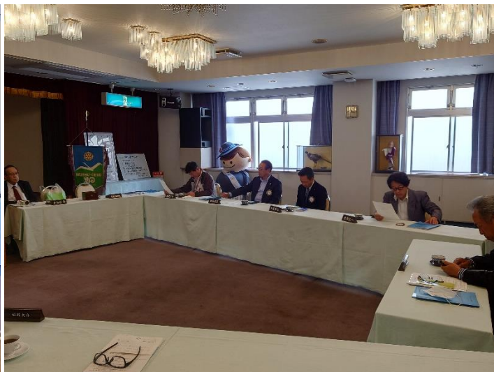
▲定例会風景（むつ中央ロータリークラブ）